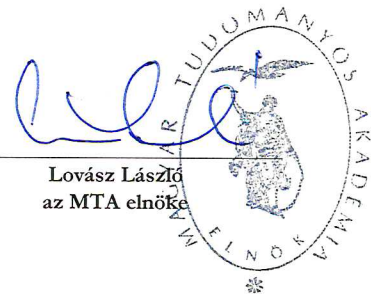
Lovász László az MTA elnöke

Az intézmény 2016. évi költségvetését jóváhagyom: